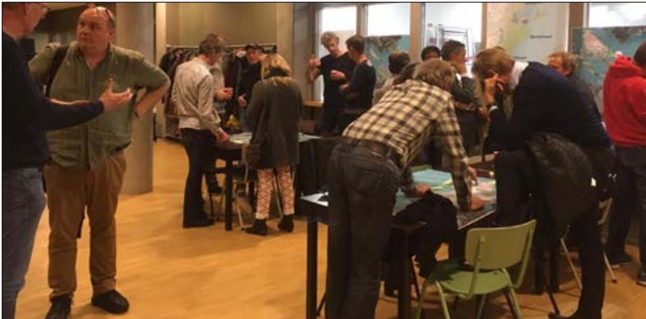
Bewonersavond 28 november 2018

Het document beschrijft de visie op het gebied, gebaseerd op de Watervisie, het oorspronkelijk ontwerp en een stedelijk en regionaal perspectief. Vervolgens wordt een typologie van het water in het plangebied, van de eilanden, de ecologie en de havens gegeven. Op grond van de visie en typologieën wordt een aantal strategische keuzes gemaakt. Daarna volgt een beschrijving van de huidige ontwikkelingen voor IJburg en Zeeburgereiland. De kaart geeft beeldend de conclusie weer van de voorliggende hoofdstukken. Tenslotte komt in het laatste hoofdstuk aan de orde hoe in de vervolgstappen na dit programma de concreet uit te voeren werkzaamheden en de noodzakelijke samenhang kunnen worden geborgd.