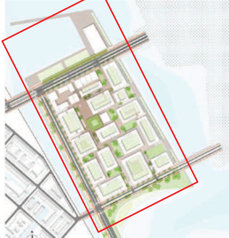
figuur 3.2 Gebiedsafbakening reikwijdte warmteplan Centrumeiland