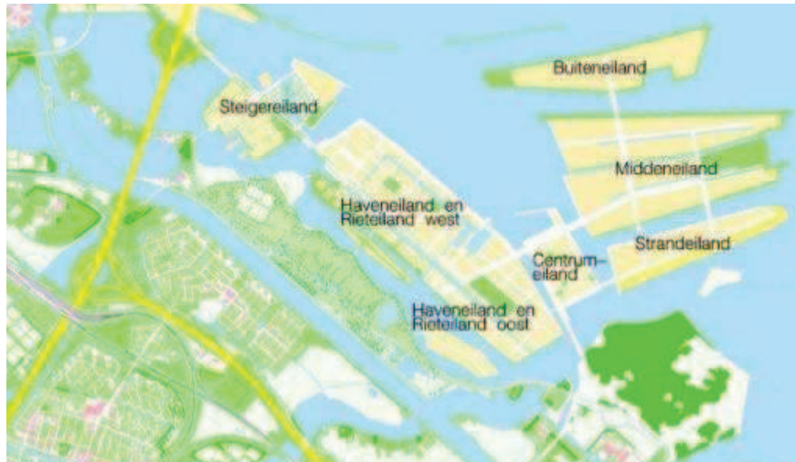
figuur 3.1 Het Centrumeiland IJburg te Amsterdam

Het plangebied voor het WKO-warmtenet waar dit Warmteplan betrekking op heeft, is het Centrumeiland IJburg te Amsterdam (zie figuur 3.1). Het Centrumeiland bevindt zich aan de noordoostzijde van IJburg. Het eiland grenst aan het reeds bestaande Haveneiland-Oost.